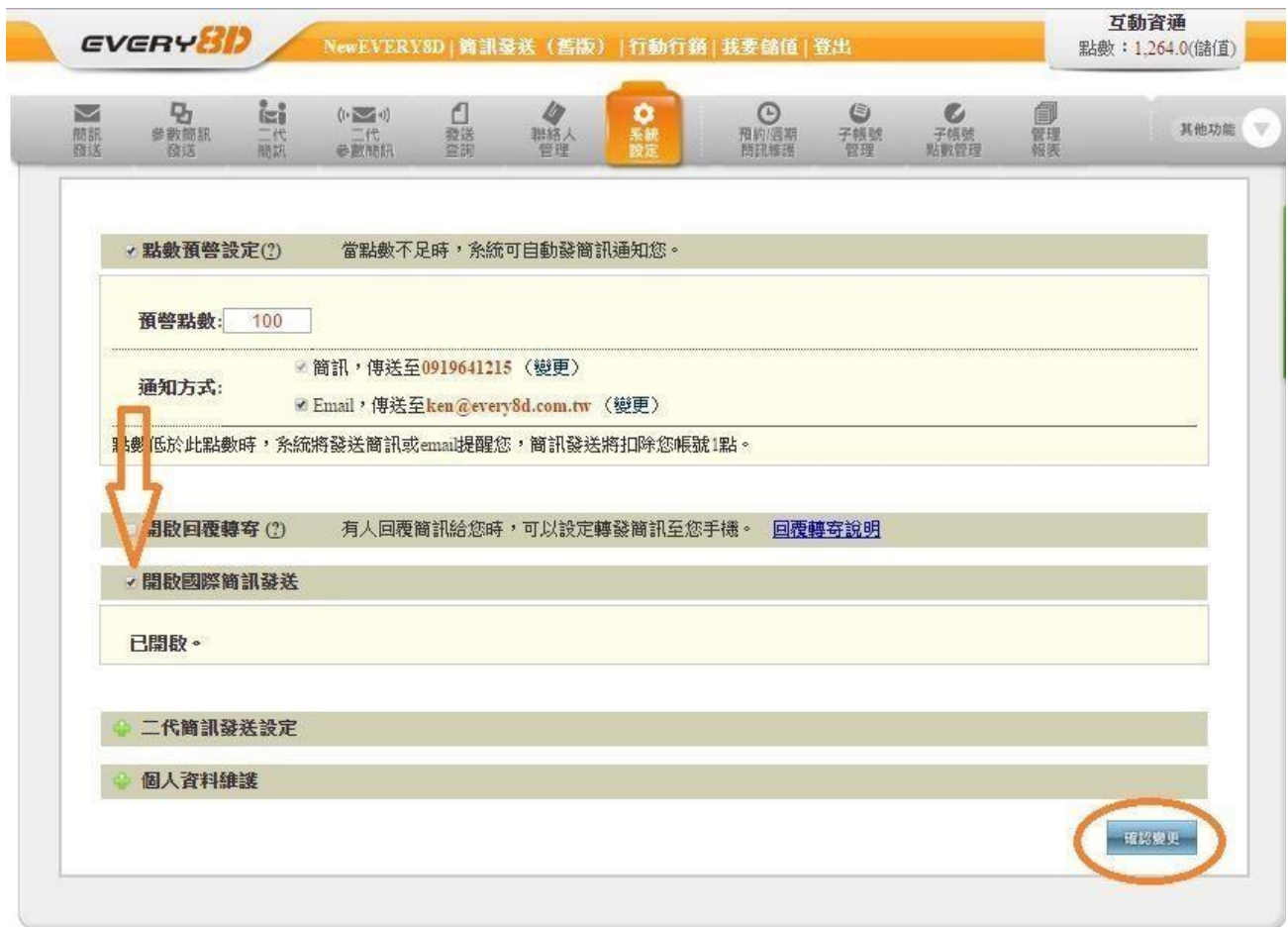
【圖】 國際簡訊發送設定