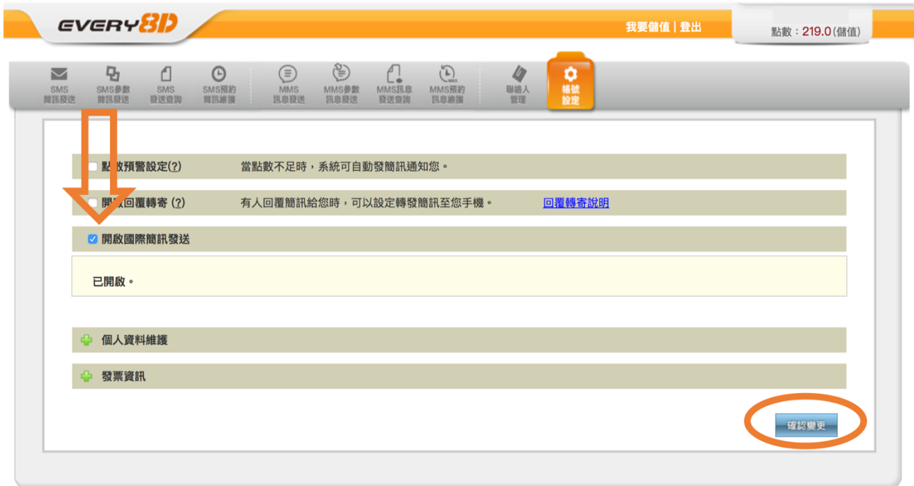
【圖】 國際簡訊發送設定